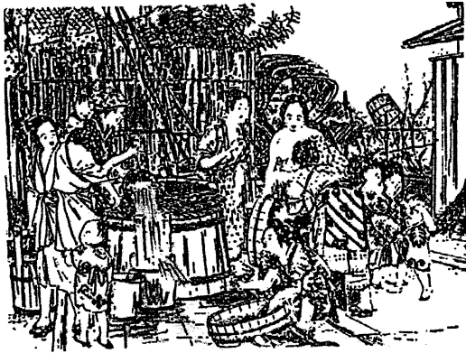
図2-16 色気に満ちた町中の「井戸端会議」の様子(明治時代後半)