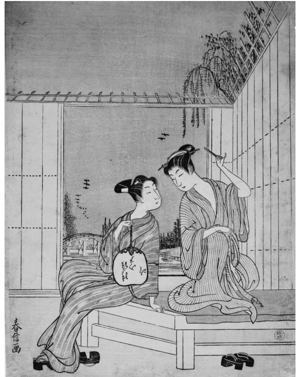
図2-15 鈴木春信「縁台の涼(納涼美人・若者)」